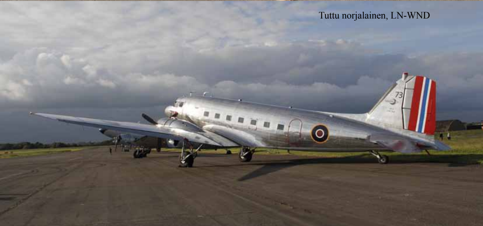
Tuttu norjalainen, LN-WND