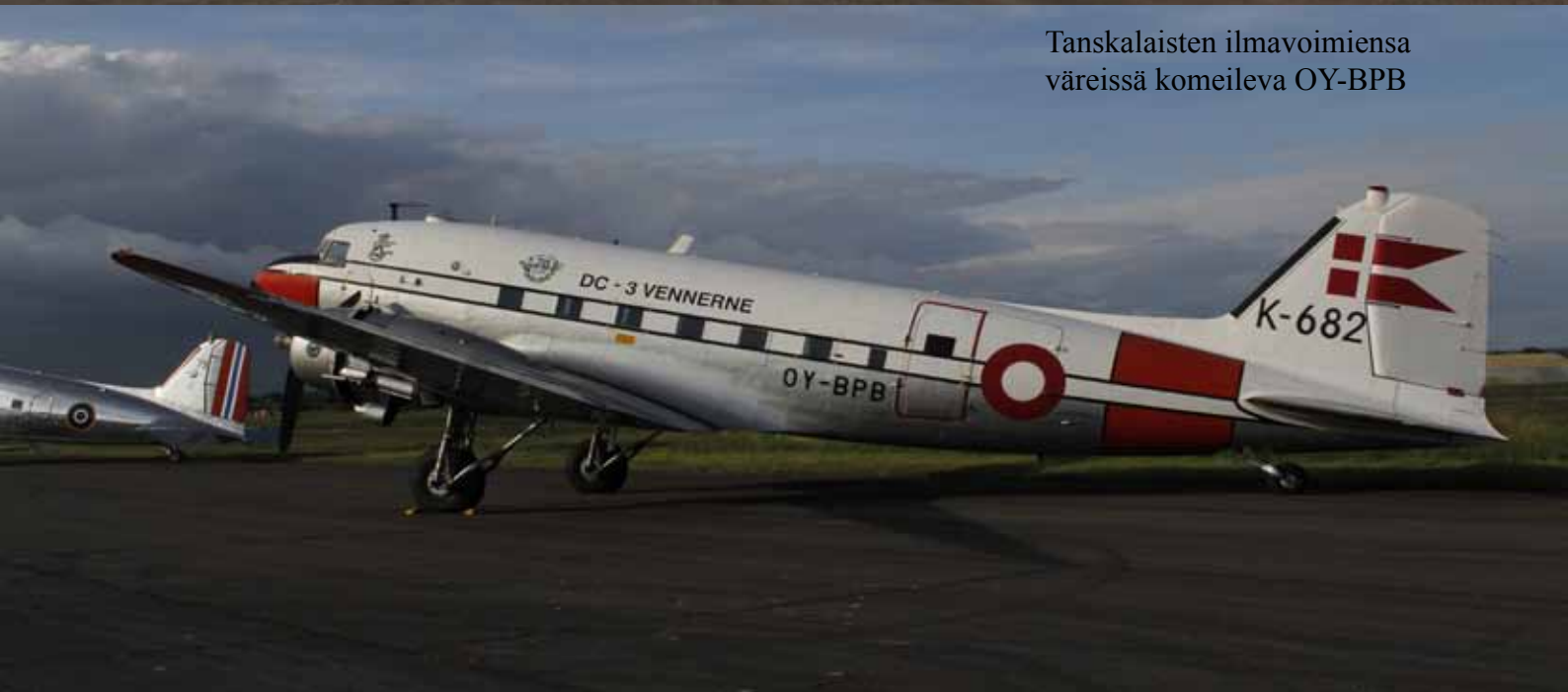
Tanskalaisten ilmavoimiensa väreissä komeileva OY-BPB