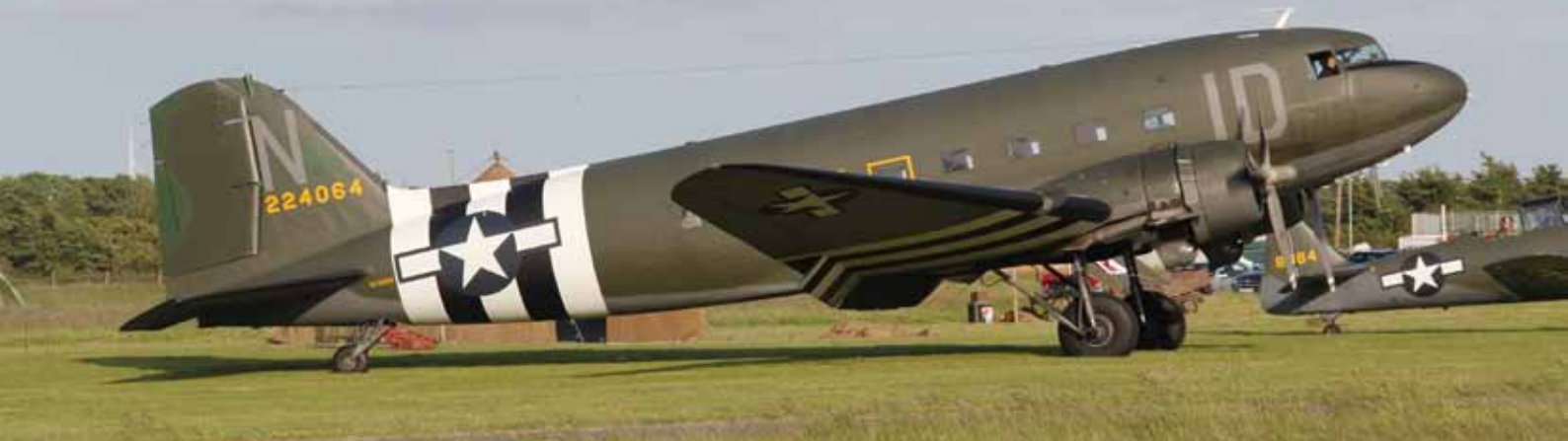
Breitling DC-3- HB-IRJ