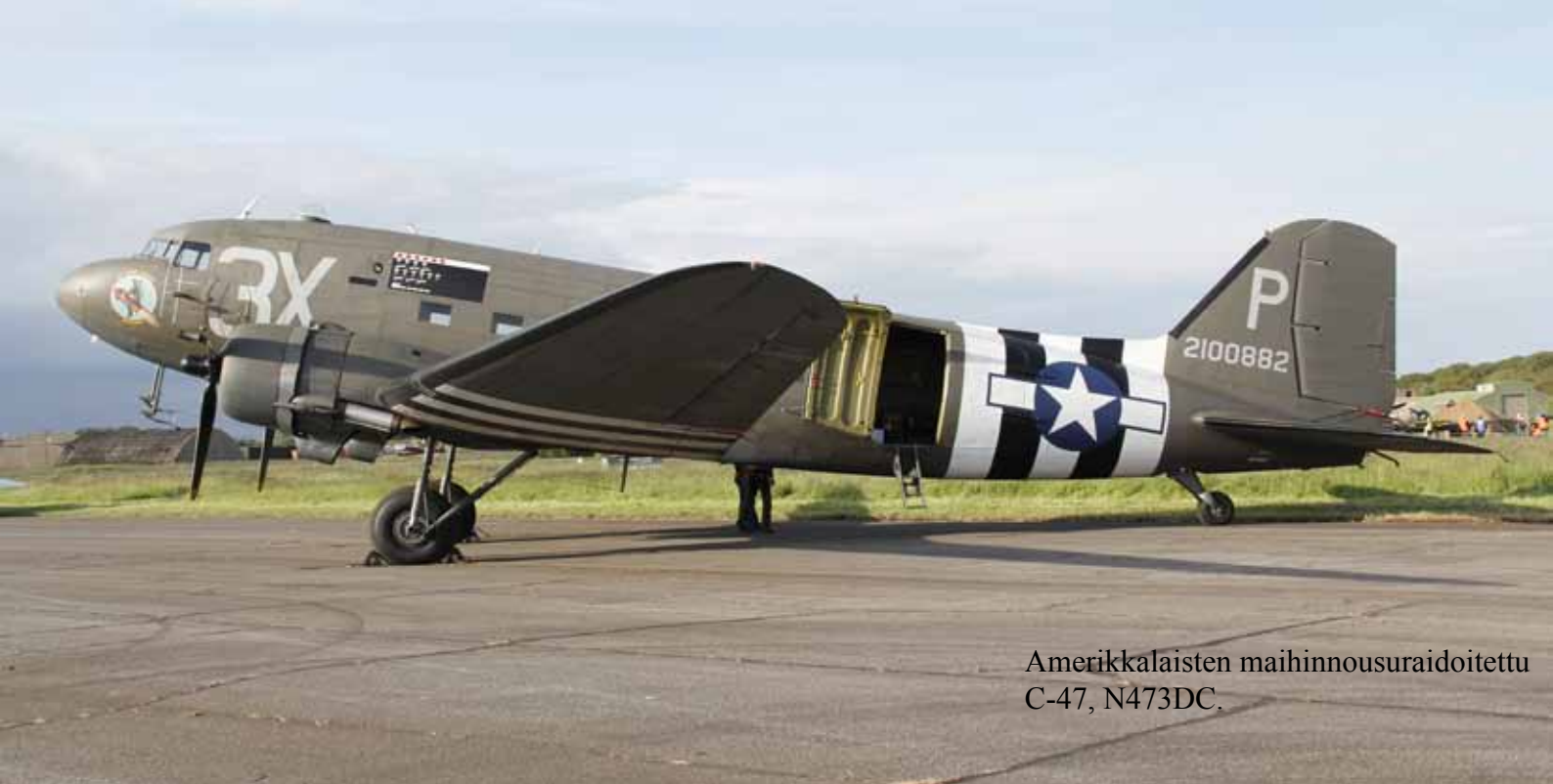
Amerikkalaisten maihinnousuraidoitettu C-47, N473DC.